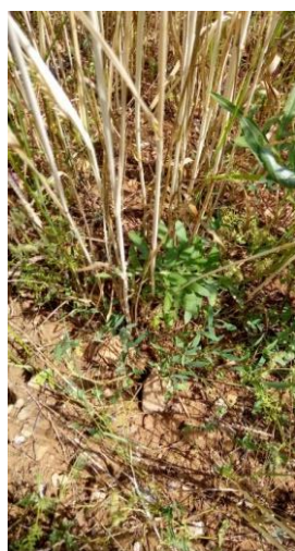
4 juillet : sainfoin sous la céréale